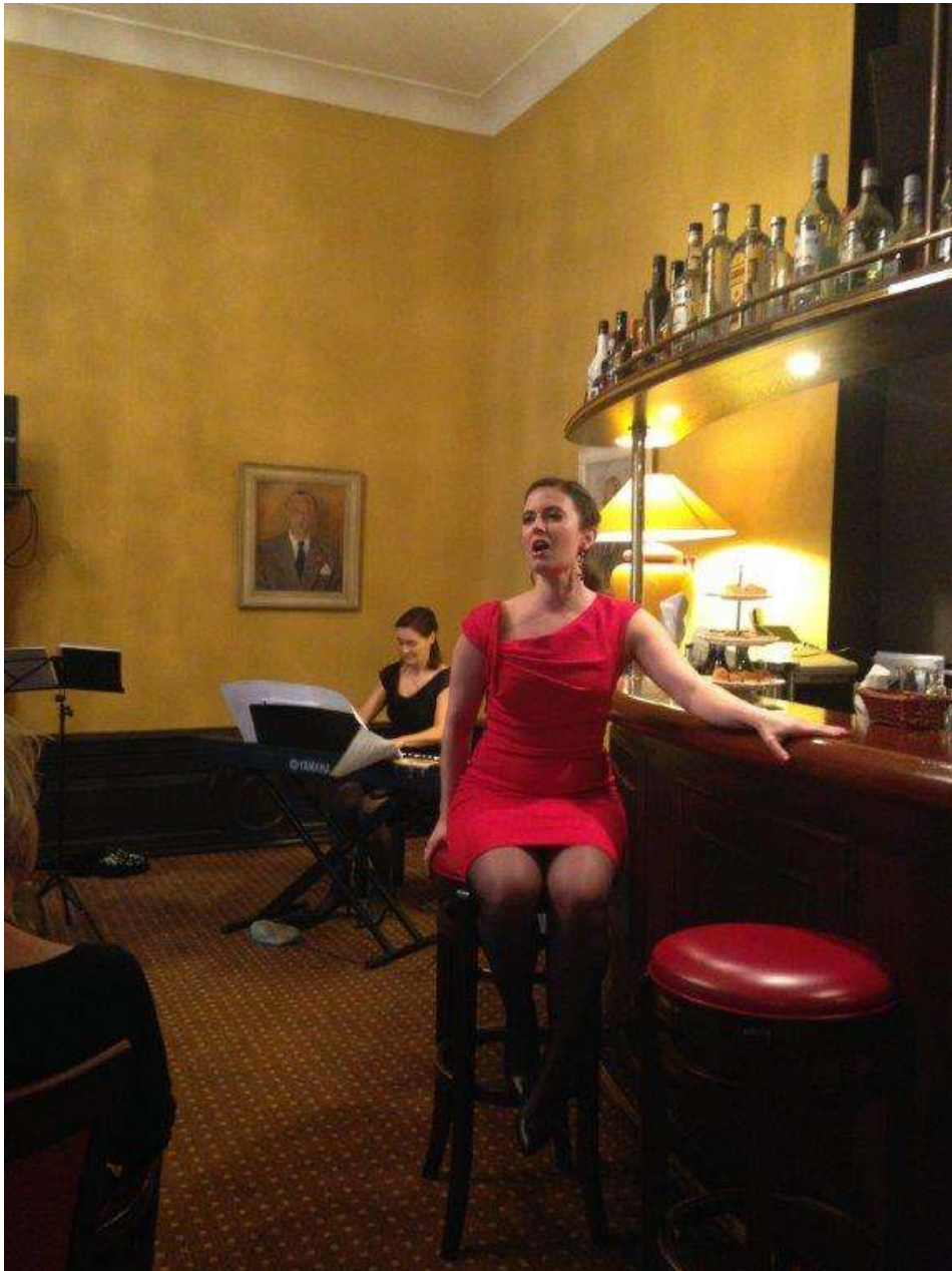
Seguidilla - Carmen, G.Bizet Gypsy Song - Carmen, G.Bizet